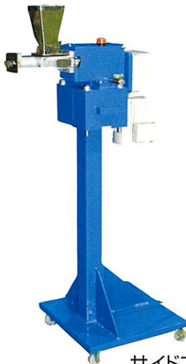
サイドフィーダー