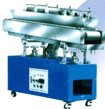
メッシュコンベアー